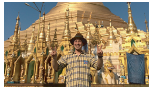
金属加工のコバテックで検索 ←

株式会社 KOBATECH 住所 三郷市谷中113-2 電話 048-95215454